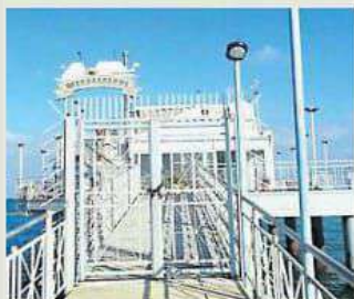
Il Mississippi di Gabicce Mare

Tra sport e concerti parte "Gabicce Maremonte"