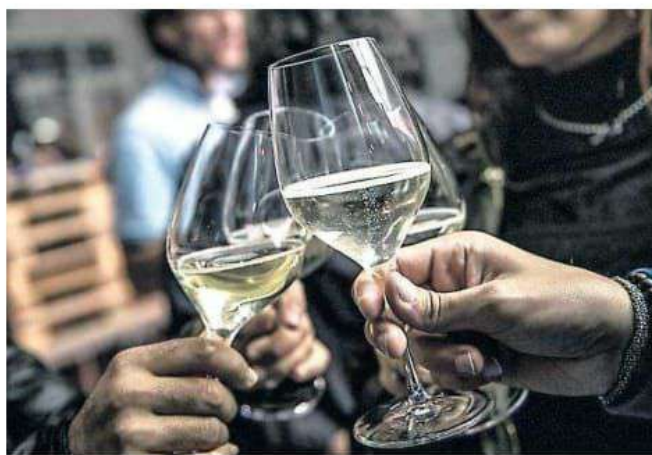
Per Pasqua i ristoranti vanno verso il sold out, ma si fa sempre più attenzione alle spese

Si va verso il sold out: il pranzo fuori è una tradizione ma con un occhio al portafogli Bene campeggi e B&b, semivuoti gli alberghi. Filippetti: «In pochi hanno già aperto»